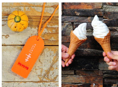
オリジナルハロウィーンホイッスルのプレゼントや通常の1.5倍のソフトクリームなど特典がたくさん