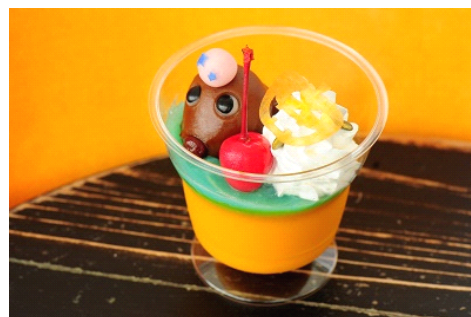
「水族館和スイーツ(ミルクティー練り切りオットセイ)」はミュージアムショップで購入も可能