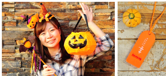
仮装して来館するとプレゼントや特典が受けられます

そのほか、ハロウィーンアイテムを身に付けて来館するとプレゼントや特典を受けることができるキャンペーンや、館内の展示とあわせてお楽しみいただけるハロウィーン仕様の体験プログラムなど、期間中はさまざまなイベントで館内が賑わいます。この時期ならではの雰囲気にもまれる京都水族館で、水族館のハロウィーンをぜひお楽しみください。