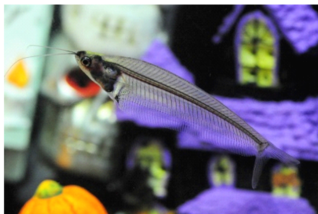
「ハロウィーンすいぞくかん」より「ブラックゴースト」(左)、「トランスルーセントグラスキャット」

「京都水族館」(京都市下京区、館長:下村 実)は、ハロウィーンイベントとしてハロウィーンをイメージしたいいきもの特別展示や仮装して来館するとプレゼントがもらえるキャンペーンなどを実施する「ハッピーハロウィーン!京都水族館」を2016年10月1日(土)～10月31日(月)の期間に開催しますのでお知らせします。