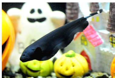
ブラックゴースト

ハロウィーンをイメージしたいきものたちを展示する「ハロウィーンすいぞくかん」では、特設展示エリア全体にハロウィーンの雰囲気を感じることができる賑やかな装飾が施され、ゆらゆらと黒い体を波打たせて泳ぐ姿がおばけを連想させる「ブラックゴースト」や、透けた見た目がまるで骸骨のような「トランスルーセントグラスキャット」、ハロウィーンらしい名前の「バンパイアクラブ」、”トリック・オア・トリート”からお菓子をイメージさせる「チョコレートグラミー」、そのほかハロウィーンカラーをイメージしたいきものなどが大集合します。