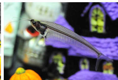
トランスルーセントグラスキャット