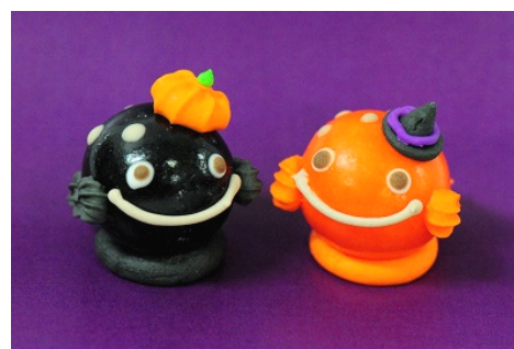
アップル味(左)とアップル+オレンジ味(右)の2種類