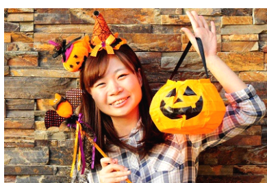
「仮装して京都水族館へ行こう！」仮装イメージ

「ハッピーハロウィーン！京都水族館」の開催期間中、帽子やマントなどハロウィーンアイテムを身に付けて来館するとオレンジ色のオリジナルハロウィーンホイッスルがもらえるほか、館内でソフトクリームをご購入いただいた方には通常の1.5倍のボリュームでご提供します。