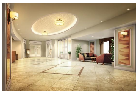
「グッドタイム リビング 宝塚逆瀬川」エントランスホール パース