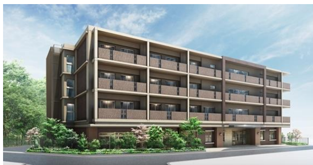
「グッドタイム リビング 宝塚逆瀬川」外観パース

オリックス・リビング株式会社(本社:東京都港区、社長:森川 悦明、以下「オリックス・リビング」)は、シリーズ 28 棟目となる有料老人ホーム『グッドタイム リビング 宝塚逆瀬川』を 2017 年 4 月にオープンいたします。オリックス・リビングでは、兵庫県での有料老人ホームの開設は 7 年ぶりとなり、宝塚市では初めての開設となります。これにより、オリックス・リビングの運営する有料老人ホーム「グッドタイムリビング」は、合計 28 棟、2,326 室となります。