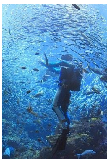
「ぐるぐる大水槽」飼育スタッフを取り囲む約10,000匹のマイワシのごはんは圧巻

第2弾の「ぐるぐる大水槽」では、「京の海」大水槽を泳ぐ魚たちのごはんの時間にしか見ることのできないさまざまな姿を飼育スタッフとの触れ合いを交えてお楽しみいただけます。「ぐるぐる大水槽」の開催にあわせて展示数を約5,000匹から10,000匹に拡大したマイワシの群れが飼育スタッフの周りを巡回しながらごはんを食べる圧巻のシーンや、たくさんの魚たちそれぞれに手渡しでごはんを与えていくようすなど、魚たちの個性や愛らしさを感じながら見ることで、これまでと違った視点でごはんの時間をお楽しみいただけます。