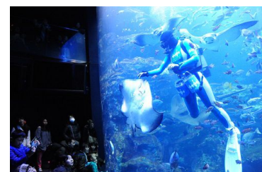
ごはんの時間に見せるさまざまないきもの表情をクローズアップ

「さあ、ごはん!」は第2弾以降もさまざまないきものにおいてシリーズ展開を予定しています。京都水族館のいきものたちの魅力をよりよく知ることができる新しいフィーディングプログラムをぜひお楽しみください。