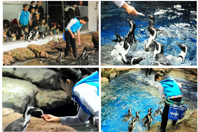
それぞれの個性や飼育スタッフとのコミュニケーションなど見どころが盛りだくさん

第1弾の「わいわいペンギン」では、「ペンギン」エリアが最も賑やかな雰囲気となる「ケープペンギン」のごはんのようすを間近でご覧いただけます。ペンギンたちは個体ごとに食欲や食べ方の癖が違い、ごはんを与える方法やテクニックは飼育スタッフの腕の見せどころ。1羽1羽とコミュニケーションを交わしながら、ごはんの時間ならではのさまざまなペンギンたちの表情や動作をお客さまと飼育スタッフが直接話しながらお楽しみいただけます。