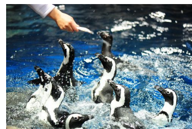
わいわいと賑やかなごはんの時間のペンギンたち

第1弾の「わいわいペンギン」では、「ペンギン」エリアが最も賑やかな雰囲気となる「ケープペンギン」のごはんのようすを間近でご覧いただきながら、飼育スタッフが1羽1羽とコミュニケーションを交わすようすをお楽しみいただけます。ペンギンたちの食欲や食べ方の癖、ペンギン同士の関係性など、さまざまなペンギンたちの表情や動作をお客さまと飼育スタッフが直接話しながらお楽しみいただけます。