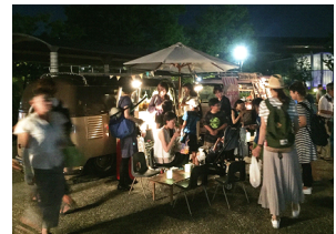
キッチンカーイメージ

作品は戦国武将を中心に動物・自然を題材とする。書を書くように命を描き、墨に濃淡をつけない独自のスタイルで、白と黒のコントラストの美しさを追求。日本各地でパフォーマンスイベントや個展を開催。