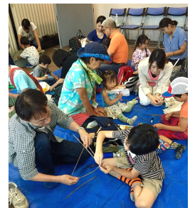
行灯をつくろう！イメージ