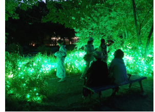
水辺のイルミネーションイメージ