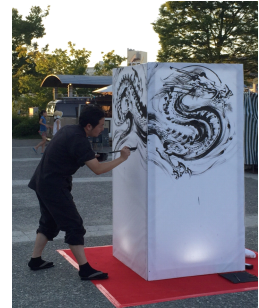
墨絵ライブイメージ