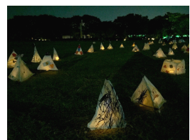
オリジナル行灯点灯イメージ