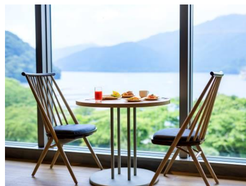
芦ノ湖を望むダイニング