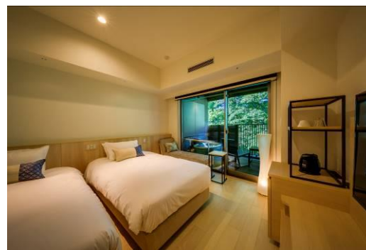
山側スタンダードツイン 露天風呂付き