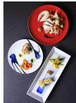
こだわりの器にメイン料理を載せて