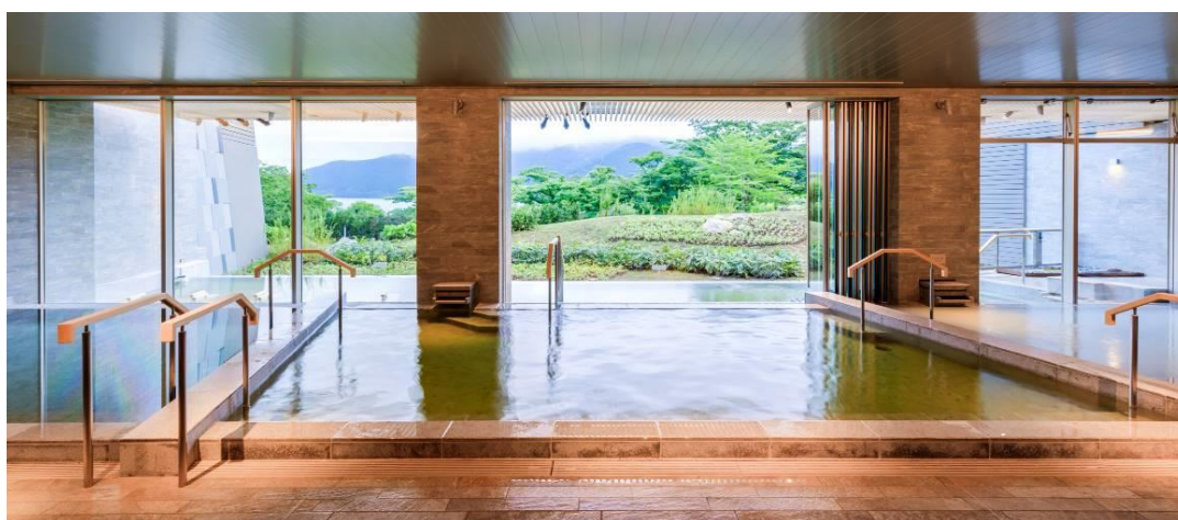
四季の露天風呂 棚湯（芦ノ湖ビュー）

営業時間：13:00~24:00、5:00~10:00 ※夜・朝で男女入れ替え制