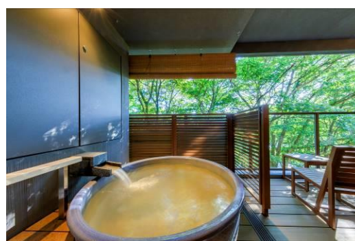
和洋室デラックスタイプ 露天風呂付き（露天風呂）