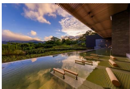
四季の露天風呂 棚湯（庭園ビュー）