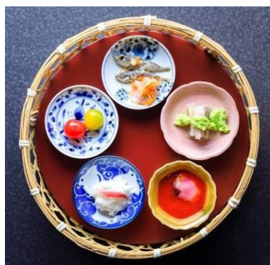
竹籠に盛った小鉢で自分仕立ての八寸