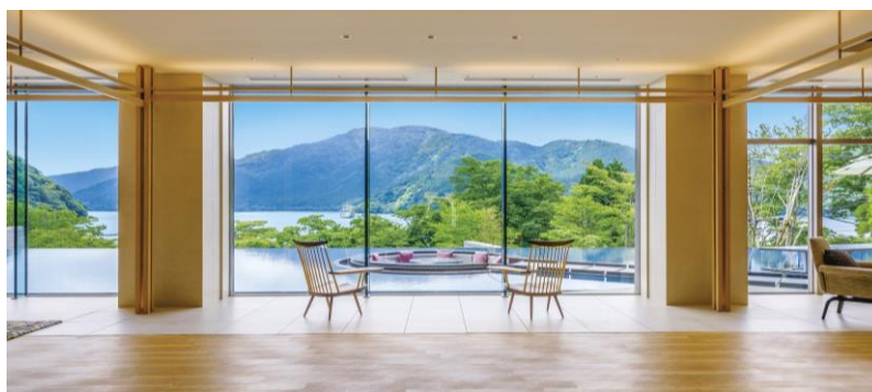
『箱根・芦ノ湖 はなをり』芦ノ湖の景観がスクリーンのように広がるロビー