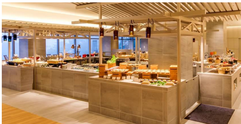
ブッフェダイニング「 とき 季しかり」

営業時間：朝食 7:00~9:30、夕食 17:30~21:30 (ラストオーダー 21:00)