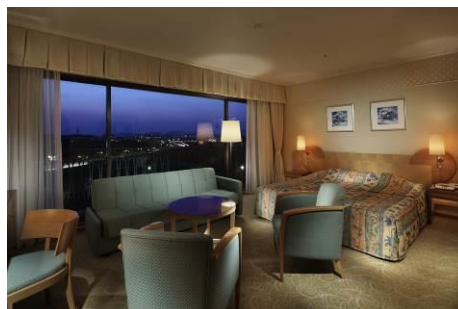
客室（ダブルルーム）