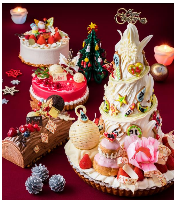
『三田ホテル』2017年手作りクリスマスケーキ

クリスマスにはご家族、ご友人と『三田ホテル』の手作りケーキを囲んで楽しくお過ごしください。