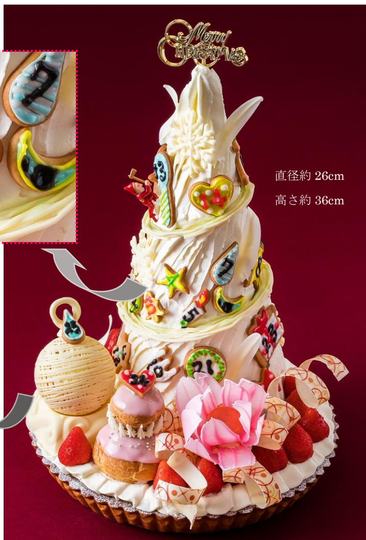
直径約 26cm 高さ約 36cm