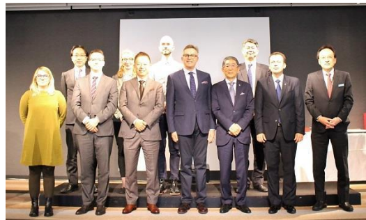
AMI とナレッジキャピタル関係者

このたびはナレッジキャピタルとの MOU 締結に至り、共同で発展していける関係を築けたことを嬉しく思います。 ポーランドと日本は、文化的な共通点が多くあると感じています。今後は、ナレッジキャピタルとの連携・交流を深め、新しい文化発信の芽を育てていきたいと思ひます。