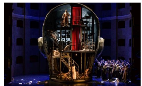
©Scena z przedstawienia "Krol Roger", reżyseria: Kasper Holten, 2015, fot. Bill Cooper / The Royal Opera