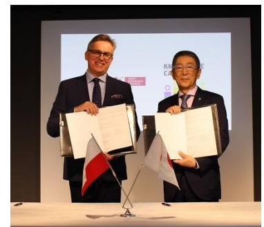
ナレッジキャピタルで行われた調印式の様子

AMIとの間では、文化・教育分野における知的交流とネットワーキングを重点項目とし、プロジェクトに関するクロスマーケティングや、文化・経済的発展と相互利益に寄与する取り組みを行うことで合意しています。