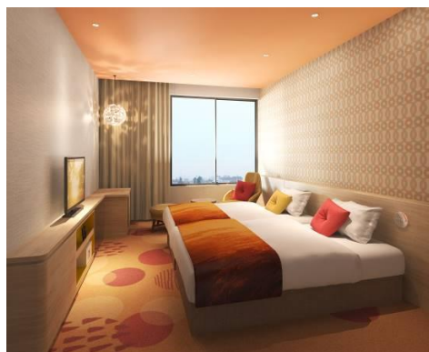
4-7階 低層階イメージ

低層階は陽だまりのような温もり、高層階は屈折するプリズムの光をイメージしたお部屋です。