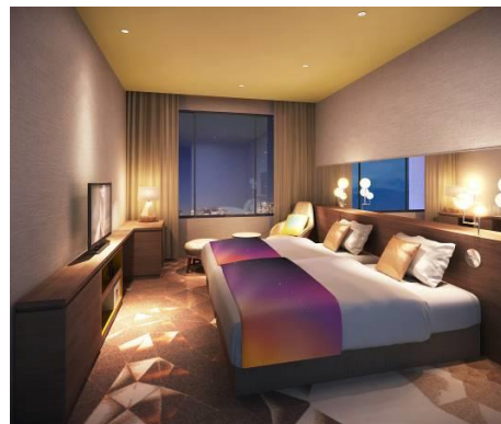
8-11階 高層階イメージ