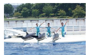
イルカトレーナー