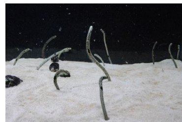
ごはんを食べるチンアナゴ