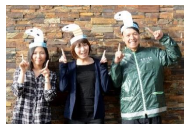
「なりきりちんあなご」