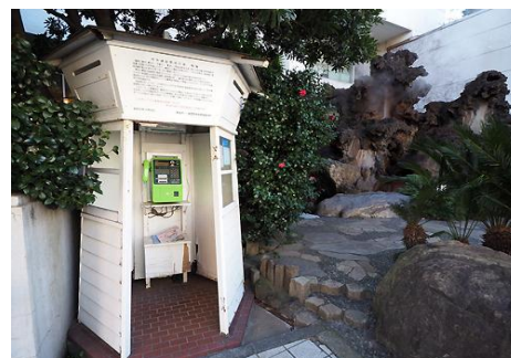
モチーフにした内務省温泉療養施設跡地の電話ボックス

毎年、当館はパティシエオリジナルのクリスマスケーキを販売しています。今年のコネプトは、「熱海の歴史に触れるスポット」とし、国内初の電話ボックスをモチーフにしたオリジナルケーキが生まれました。