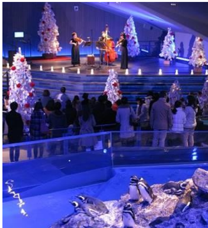
限定演奏会「ペンギンと音楽の夜」(12/22～24 開催)