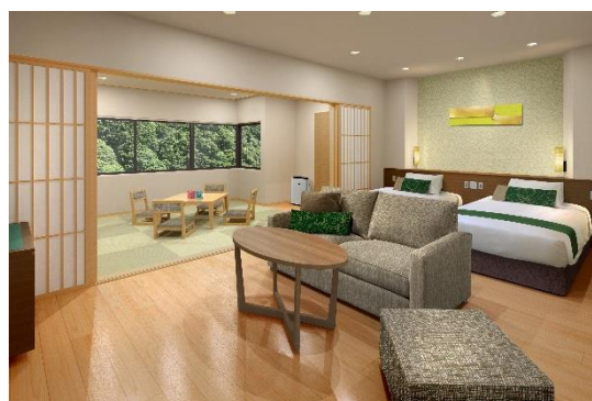
「別館 飛鳥 デラックス和洋室」イメージ

当館は、2018年9月に名称を「宇奈月 杉乃井ホテル」から「黒部・宇奈月温泉 やまのは」へ改称しました。このたび、本館の耐震化、客室の増設、貸切風呂やリラクゼーションルームの新設工事を終え、お客さまがより安心してお寛ぎいただける施設としてリニューアルオープンします。