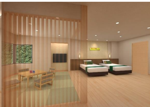
別館 和洋室イメージ