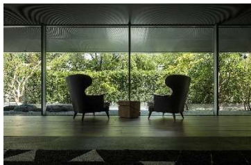
クロスホテル京都