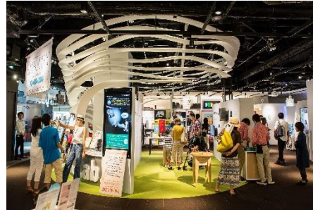
The Lab.みんなで世界一研究所

「ザ・ラボ」では、参画する企業や大学、研究機関による先端技術、研究成果、製品・サービスのプロトタイプ展示や、ワークショップなどの体験プログラムを実施しています。参画者は一般生活者のリアルな反応や意見をダイレクトに収集し、今後の製品開発や商用化、販売展開などへ反映することができます。現在、13の機関が参画し、ナレッジキャピタルの中核機能を担うスペースです。