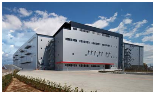
「松伏ロジスティクスセンター」外観

本物件は、延床面積 23,405 坪、最小区画約 2,500 坪から最大 8 テナントの入居が可能です。東京都心から約 30km 圏内で、東京外郭環状道路（外環道）、国道 16 号へのアクセスにも優れた、物流拠点に適したエリアに位置しています。建物 1 階と 3 階の中央部に車路とトラックパーキング*を備え、非常用発電機を設置するなどの事業継続計画（BCP）に対応しているほか、環境に配慮した省電力 LED 照明を採用しています。