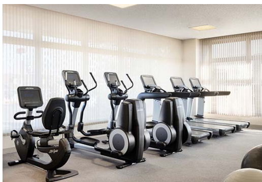
フィットネスルーム (イメージ)