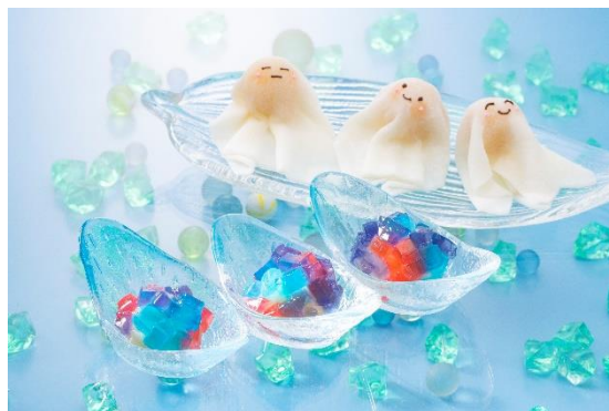
手前：あじさい、奥：てるてる坊主

スイーツは、当館でパティシエが製作するオリジナルで、和洋の約35種をお楽しみいただけます。第2弾は、6月の梅雨の時期を食で楽しめるよう、雨を連想するモチーフを使ったメニューが登場します。みそ味のおんこを求肥（ぎゅうひ）で包んだ“てるてる坊主”や、寒天と餡を材料に水無月を表現した色鮮やかな“あじさい”スイーツです。