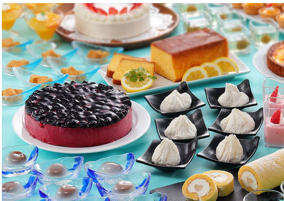
パティシエによる手作りスイーツ