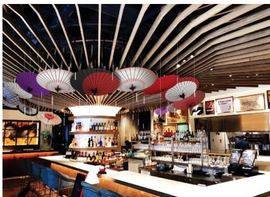
クロスホテル京都