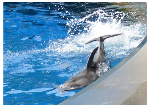
イルカのアクションによる水しぶき

プールのすぐそばまで来るイルカが、尾びれなどを大きく使い豪快なアクションを行います。イルカと近い距離で一緒に水遊びをお楽しみいただけます。