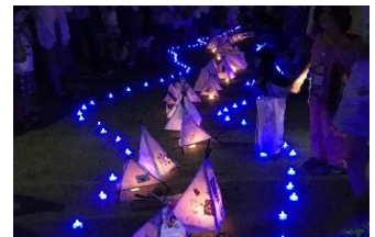
オリジナル行灯 (イメージ)

開催日：2019年8月3日(土) 開催時間：午後5時～午後8時30分 (行灯の点灯は午後7時15分ごろ～) 開催場所：芝生広場 野外ステージ付近 対象及び定員：親子(小学生までのお子さま) 先着100組 ※1組1セット 申込方法：①参加人数(大人・子どもの各人数) ②代表者の氏名 ③電話番号 ④メールアドレスを記載し、7月24日(水)までに下記のメールアドレス宛に申し込みをしてください。 申込先： umekouji.tourou@gmail.com