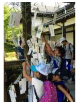
笹に願いごとを (イメージ)

設置日時：2019年8月3日(土)、4日(日) 設置箇所：京都水族館、京都鉄道博物館、市電カフェ、市電ショップ、 梅小路パークカフェ、緑の館、中央広場、七条入口広場 ※中央広場、七条入口広場は、10日(土)～12日(振休・月)も設置