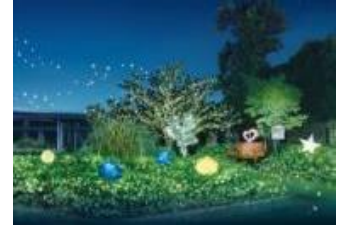
イルミネーション (イメージ)

開催日：2019年8月2日(金)～8月12日(振休・月) 開催時間：午後7時～午後10時 開催場所：中央広場、中央園路、七条入口広場