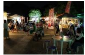
夏の夜空のレストラン (イメージ)

開催日：2019年8月3日(土)、4日(日)、 10日(土)～12日(振休・月) 開催時間：午後2時～午後9時 開催場所：中央広場、七条入口広場 ※8月3日(土)は中央広場のみで実施