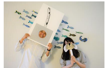
フォトプロップスイメージ