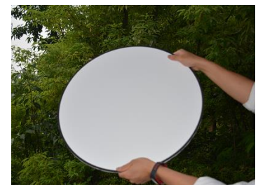
レフ板無料貸し出しサービス