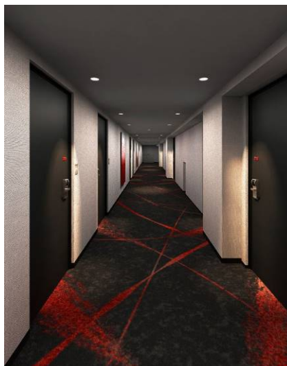
客室階共用部廊下 (イメージ)