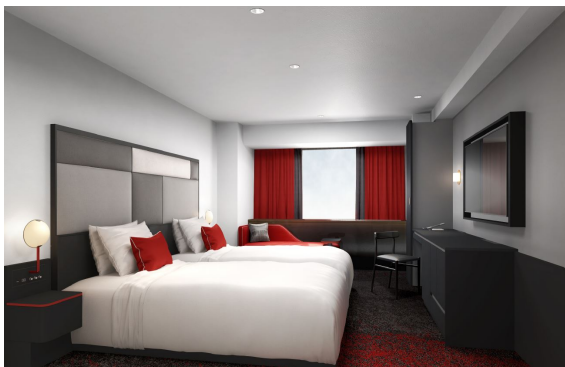
スタンダードフロア ツイン (イメージ)

客室全 229 室を順次リニューアルします。ツインルーム (27 m 2 )、ダブルルーム (24 m 2 ~31 m 2 )、トリプルルーム (27 m 2 ) の 3 種類のルームタイプが揃う 6~12 階 (178 室) を「コンフォートフロア」から「スタンダードフロア」に改称し、赤色をアクセントとしたデザインの客室とモノトーンのデザインを基調とした客室の 2 種類をご用意します。スイートルーム 2 室をもつ 13、14 階の「クロスフロア」(51 室) の客室は、ゴールド系の配色で、より洗練された内装に一新します。クローゼットや机などの家具の配置を変更し、室内でゆとりをもってお過ごしいただけます。滞在中の大型スーツケースの荷造りに便利なスペースを確保しました。