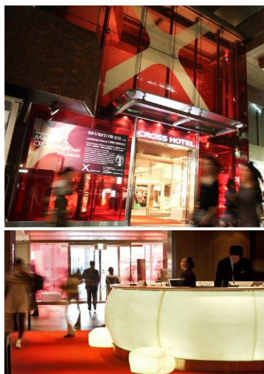
赤が特徴のエントランスとフロント

エレベーターホールや廊下などの共用部分を、「Flowing Energy」をコンセプトに、御堂筋や道頓堀の賑わいや熱量が一つの流れとなり、エントランスから客室までたどり着くイメージを表現したデザインにします。廊下に、ホテルのイメージカラーである赤色の流線をあしらひ、外観、エントランスから客室まで赤い色が特徴の統一された空間となります。