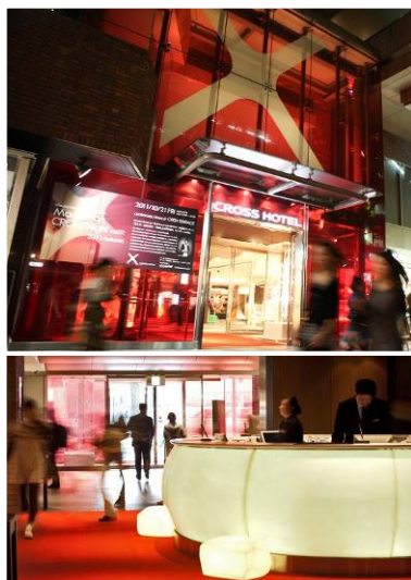
赤が特徴のエントランスとフロント

エレベーターホールや廊下などの共用部分を、「 Flowing Energy 」をコンセプトに、御堂筋や道頓堀の賑わいや熱量が一つの流れとなり、エントランスから客室までたどり着くイメージを表現したデザインにします。廊下に、ホテルのイメージカラーである赤色の流線をあしらい、外観、エントランスから客室まで赤い色が特徴の統一された空間となります。