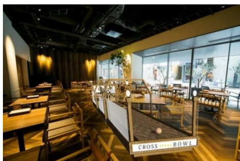
クロスホテル京都「CROSS BOWL」イメージ