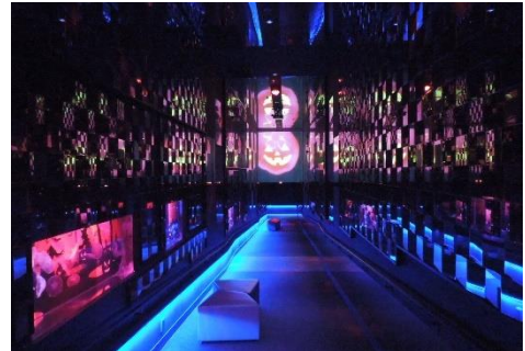
ハロウィンバージョンの万華鏡トンネル