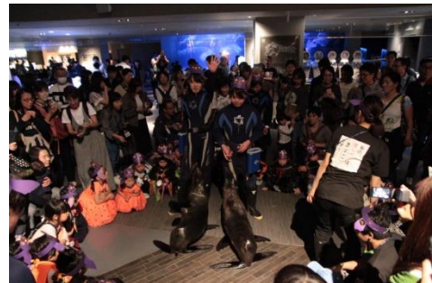
昨年の「ハロウィンオットセイパレード」の様子

開催内容：ハロウィンイベント限定仕様のオットセイのお面をかぶり、オットセイと一緒に館内をパレードします。パレードの終盤には、飼育スタッフと一緒に練習したハンドサインで、オットセイとコミュニケーションを取ることができます。大きな声で「トリック・オア・トリート！」のかけ声をかけましょう。