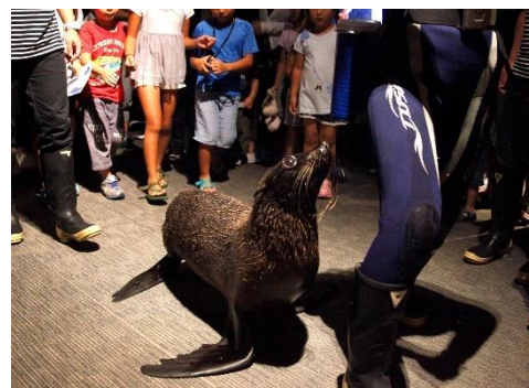
オットセイと一緒に館内をパレードしましょう！