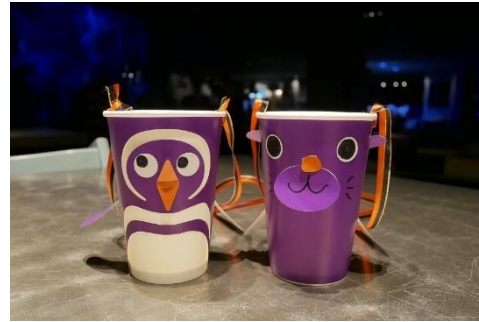
ペンギンとオットセイのハロウィンカップイメージ