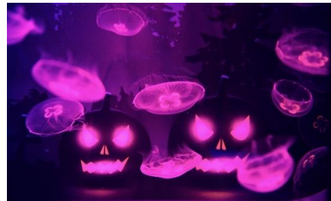
ジャック・オー・ランタンの背景とミズクラゲ