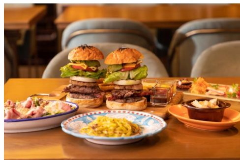
クロスボウル シェアディナーコース（イメージ）

【内 容】2名様でシェアして楽しみいただくディナーコース。グランドメニューの中から人気メニューを集めました。メインは、「Bring Your Own Style（お好きなスタイルで）」を意味する「KIHARU BYOS（ビオス）バーガー」で、肉厚なビーフパテやサーロインステーキ、フォアグラソテーを、4種の野菜や5種のソースを自由に組み合わせ