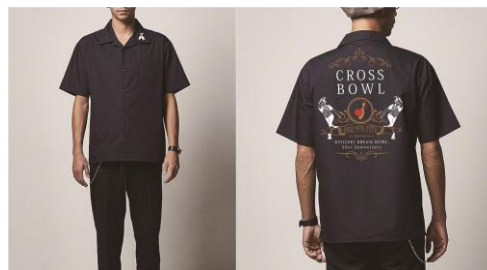
オリジナルのボウリングシャツ（イメージ）

2015年に閉店したボウリング場「京劇ドリームボウル」の跡地に開業しました。1周年を記念し、ボウリング場をイメージしたレトロな空間を演出します。実際に投球することができる小型のボウリングレーン「CROSS BOWL」やイベントオリジナルのボウリングピ