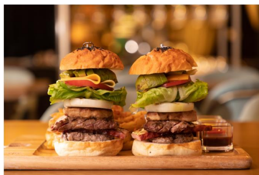
記念ディナーコースのBYOSバーガー（イメージ）

当ホテルは、京都の新旧の文化が交差する河原町三条で、1969年のオープン以来、地域に親しまれてきたボウリング場「京劇ドリームボウル」の跡地に開業しました。本イベントでは、「CROSS BOWL（クロスボウル）」と題し、館内のさまざまな場所で、ボウリング場をイメージするさまざまな演出、メニュー、そしてイベントなどを展開します。