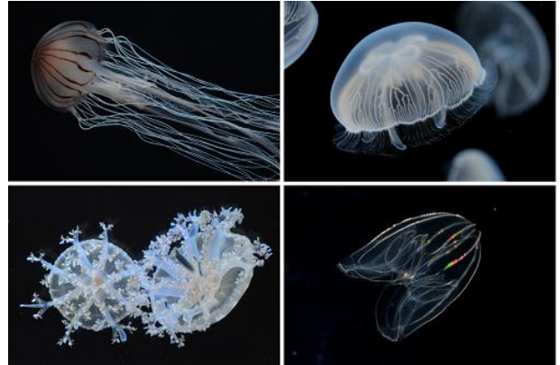
西日本最多の約 20 種 5,000 匹のクラゲを展示予定（イメージ）

本リニューアルで、クラゲの展示数は、現在の 8 種約 400 匹から、西日本最多の約 20 種 5,000 匹となる予定です。これまで展示してきたアカクラゲやサカサクラゲに加えて、京都水族館では初となるクラゲの種類も展示しています。また、多数の種類の子クラゲの繁殖や成長の様子をご覧いただけるため、種類ごとに異なる成長過程での見た目や生態の違いなどもお楽しみいただけます。