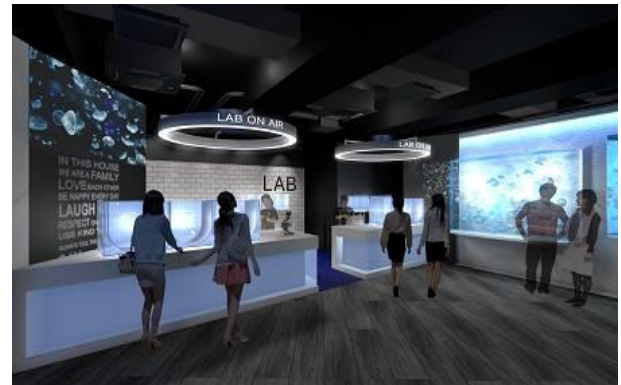
クラゲの繁殖過程を観察できる水槽展示（イメージ）

新展示エリアには、直径 6.5 メートルのドーム型の水槽を新設し、一歩中に足を踏み入ると 360 度囲まれた水槽にクラゲが優雅に漂う空間に包まれ、まるでクラゲと一緒に海に浮かんでいるかのような感覚をお楽しみいただけます。また、これまでバックヤードで行っていたクラゲの繁殖、研究などの作業をオープンスペースで行うため、飼育スタッフと会話をしながら、より詳しく生態などを学んでいただくことができます。