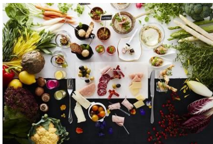
ビュッフェイメージ