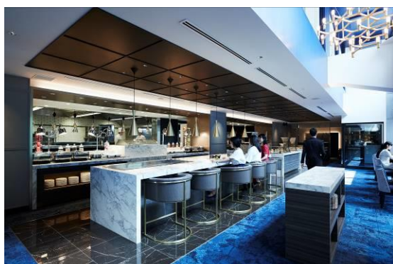
オープンキッチンのある DINING-A

（DINING-A、DINING-B、DINING-C、BAR 127席、半個室 2室（8席、6席）、TERRACE 32席、PRIVATE DINING 10席）