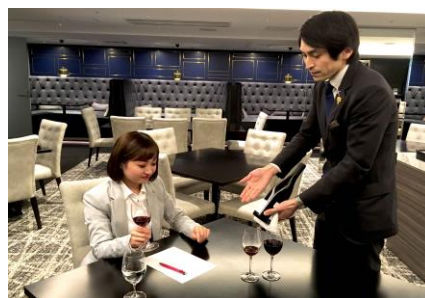
ワイン講座イメージ