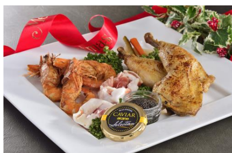
パーティーフード