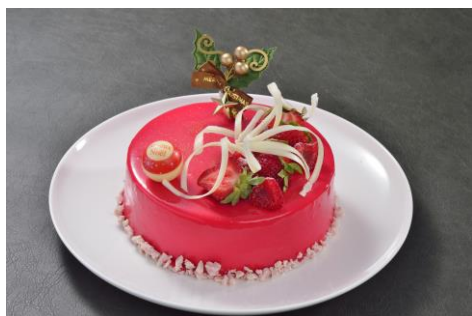
フリーズシトロン