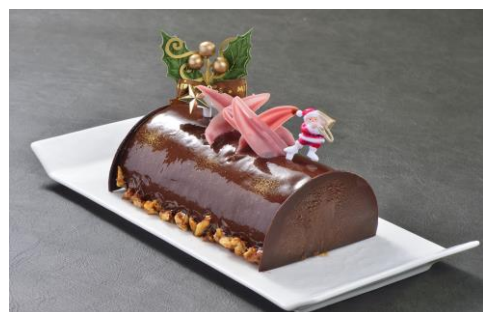
ショコラ・カフェ