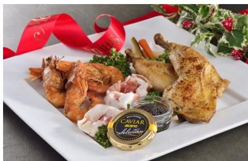
パーティーフード