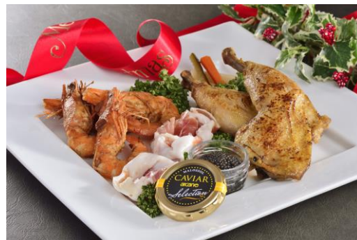
パーティーフード