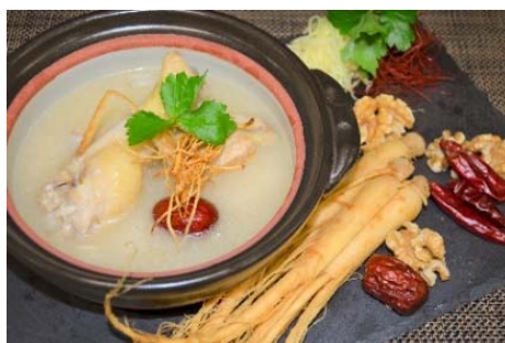
オタネニンジンを使用した「参鶏湯風鍋」