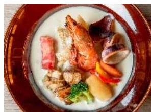
「はこだてチャウダー」