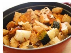
「いろいろ根菜のロースト」