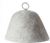
「オリジナルサウナハット」