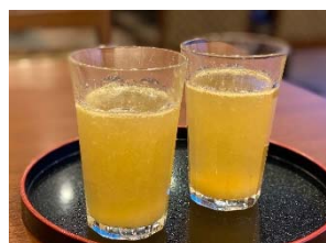
「はちみつジンジャー」