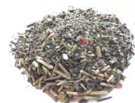
唐辛子入りほうじ茶