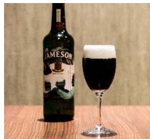
アイリッシュコーヒー