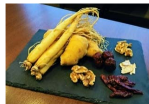
オタネニンジンや生姜