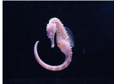
しっぽが特徴的なビッグベリーシーホース