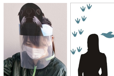
館内で使用するフェイスガード（左）、ビニールシート（右）（イメージ）

スタッフにも親しみを持っていただけるよう、飛沫防止のためにスタッフの一部が着用するフェイスガードやレジカウンターに設置するビニールシートに、オットセイやペンギンなど、さまざまないきものデザインをあしらいます。