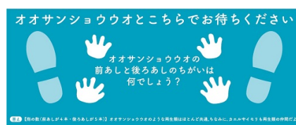
オオサンショウウオの足形シート（イメージ）

フロアシートには、いきものの足形に関するクイズを掲載し、順番待ちの際にもお楽しみいただけます。