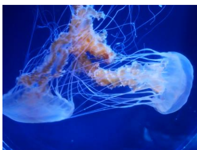
ブラックシーネットル