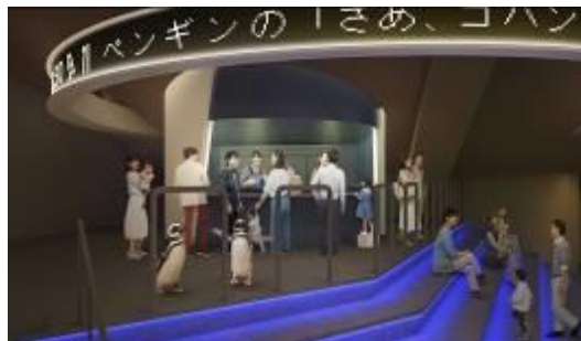
飼育スタッフとのコミュニケーション（イメージ）

飼育スタッフとのコミュニケーションや飼育作業の観察を通して、子どもだけでなく大人の知的好奇心も刺激する学びのエリアとなります。新しい「ラボ」では、今回初めて展示するビゼンクラゲやキャノンボールジェリー、ブラックシーネットルなど多くの種類のクラゲの繁殖活動に取り組み、クラゲに関する体験プログラムなども今後開催する予定です。