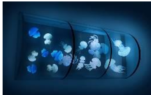
壁面に設置する 3 つのドラム型水槽（イメージ）

今回のリニューアルにより、館内で展示する約 14 種 700 匹のクラゲはすべて、すみだ水族館で繁殖をした個体となります。