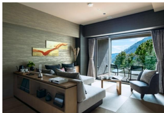
客室棟 東「和タイプ」

「箱根・強羅 佳ら久」は、オリックス不動産が新築する2件目の温泉旅館です。お客さまごとに異なる「宿に求める距離感」を大切に、予約時からお客さまに滞在中の過ごし方や食事の好みなどを伺うことで、一人ひとりに寄り添ったおもてなしを目指します。また、強羅の自然素材をあしらった外観や内装、眺望や自然を体感できる客室、棟の間に配置されたテラスなど、お客さまごとにお好みの場所を見つけてお過ごしいただけます。