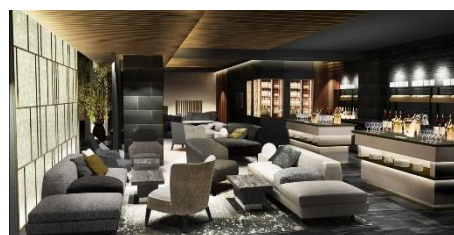
ゲストラウンジ「間 (AWAI)」

「ゲストラウンジ 間 (AWAI)」は、施設の中心となる場として、客室棟への導線上に配置しました。夕食後のアルコールや朝食後のコーヒーなど、日中や入浴後にのんびりとくつろいでいただけます。また、敷地内に設けた「水のテラス」と「森のテラス」では、自然を感じながらお過ごしいただけます。