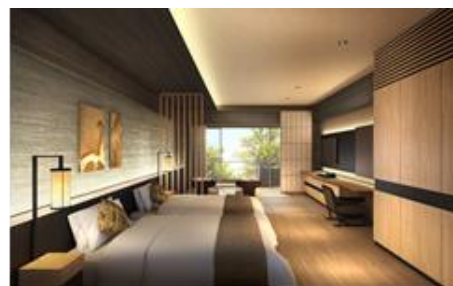
客室棟 西「和タイプ」(56.1㎡) (バルコニー含む)

客室は、全室デラックスルームの洋・和の2タイプで、バルコニーを含め約56㎡（居室は約44㎡）の広さです。客室露天風呂を楽しみながらくつろいでいただけるよう、バルコニーの広さにもこだわっています。客室内は、日本の伝統的な素材（和紙・木格子など）を使用し、強羅の自然風景を取り込んだしつらえにしているほか、卓を配してリビングと寝室を緩やかにゾーン分けすることで、滞在時の快適性にも配慮しています。