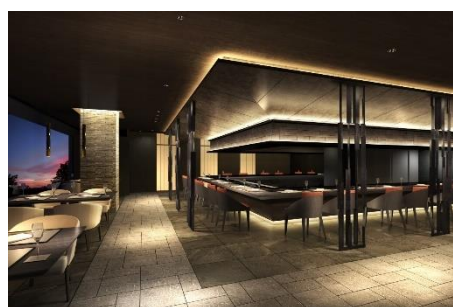
グリルダイニング「十邑（とむら）」