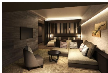
客室棟 東「洋タイプ」(57.8㎡) (バルコニー含む)