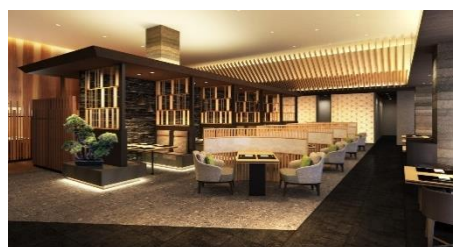
メインダイニング「六つ喜（むつき）」

「十邑（とむら）」は、シェフのダイナミックな技とともに、厳選された肉や海鮮、旬の野菜などを鉄板焼きでぜいたくに楽しめるグリルダイニングです。別館最上階に位置するこのレストランからは、明星ヶ岳と大文字の景色をご覧いただけます。カウンター席、個室、テーブル席をご用意しています。