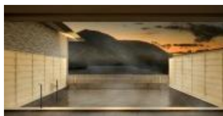
展望露天風呂「明星」

大文字や相模湾まで見通すことができる本館最上階には、箱根屈指の展望露天風呂「蒼海」と「明星」を設けました。また、それぞれに内風呂、サウナも備えています。