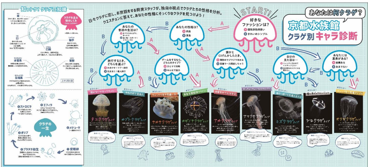
クラゲ別キャラ診断（イメージ）