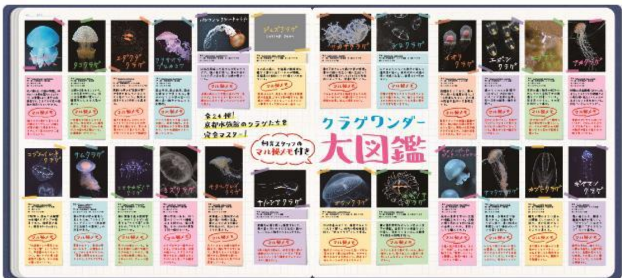
クラゲワnder大図鑑（イメージ）