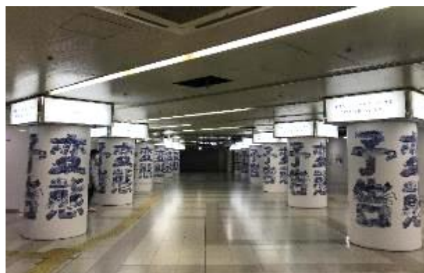
大阪市営地下鉄「梅田」駅 広告掲出のようす