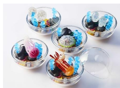
商品名：カプリウムコレクション クラゲ 京都水族館限定 料 金：500円（税込み） 販売場所：2階交流プラザ