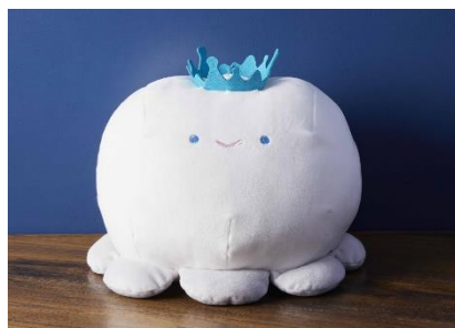
商品名：クラゲクッション王冠付き 料 金：3,300円（税込み） 販売場所：1階ミュージアムショップ