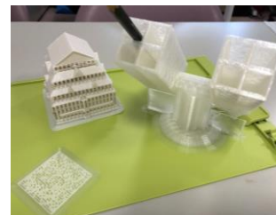
3D プリンター作品イメージ

本講座は、ジュニアドクター育成塾の事業であるめばえ適塾とのコラボレーション講義です。パソコン、タブレットを駆使して3Dデータを作成し、3Dプリンターで印刷するまでの一連の工程を全6回の連続講義を通じて実践的に学びます。