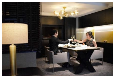
クロススイート イメージ

8月にリニューアルしたクロススイートの客室で、クリスマスディナーのフルコース、乾杯用のシャンパン、ケーキ「ビュッシュ・ド・ノエル」をご用意します。期間限定のクリスマスの装飾が施された空間で、特別な日をお過ごしください。