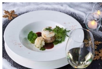
クリスマスディナーコース イメージ

クリスマスディナーのフルコースと朝食が付いた宿泊プランです。客室は、ゴールドをアクセントにした落ち着いた感じのある内装とこだわりのアメニティや設備を備えたクロスフロアからお選びいただけます。