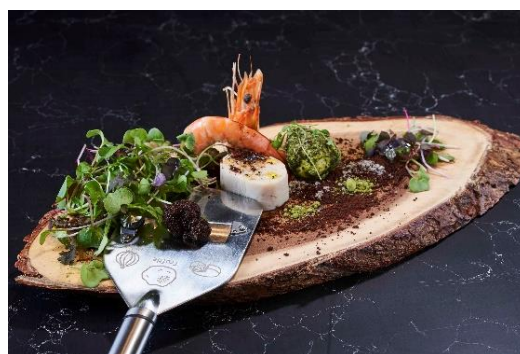
「春への序章」 イメージ