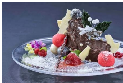
ビュッシュ・ド・ノエル イメージ

フランスのクリスマスの伝統ケーキである「ビュッシュ・ド・ノエル」を客室までお届けします。チョコレートをふんだんに使用しながらもベリーの酸味がアクセントになったホテルのオリジナルです。お部屋でゆったりとクリスマスをお祝いしたい方におすすめの宿泊プランです。