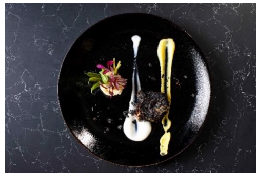
交雑牛“石”ロテイ 2種のピュレ イメージ

クリスマスディナーは、フランス語で「真っ白い雪」を意味する“Blanc Neige (ブランネージュ)”をコンセプトに、和のアレンジを加えた全7品のフレンチコースです。地元関西エリアのその時々旬の食材を使用したホテルオリジナルのコース「ガストロノミー関西」をベースにし、フォアグラなど特別コースならではの素材を贅沢に使用します。