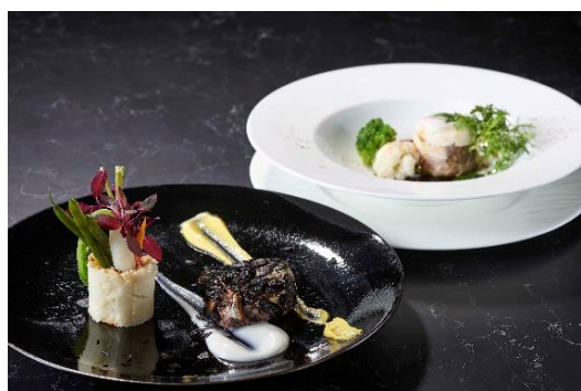
メイン料理 イメージ

フランス語で真っ白い雪を意味する“Blanc Neige（ブランネージュ）”をコンセプトに、ムースのような泡状にした「エスプーマ」や泡立てた卵白の「淡雪」を用いて雪を表現します。ホテルオリジナルのディナーコース「ガストロノミー関西」をベースに、クリスマスならではの贅沢な食材を使用した、前菜からデザートまで全7品のコースです。