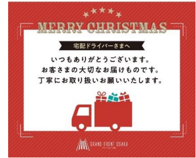
配送用オリジナルステッカー イメージ