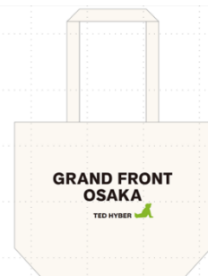
オリジナルグッズ イメージ