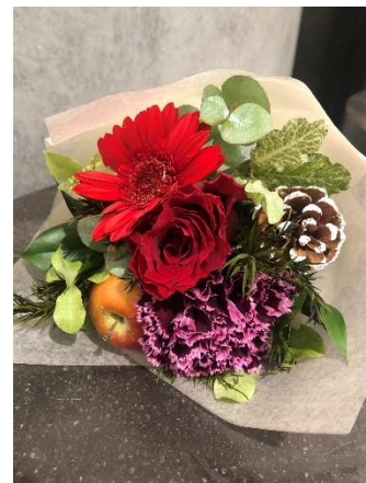
クリスマスミニブーケ イメージ