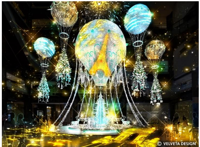
ライティングショー時