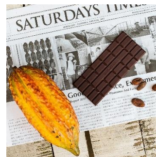
サタデイズチョコレート

カカオの生豆から作る「ビントゥバーチョコレート」を販売する北海道のチョコレート専門店。