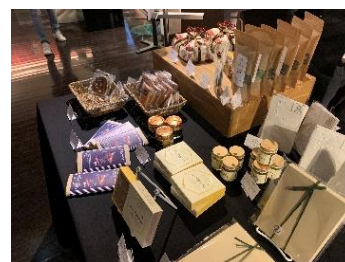
2019 年のマーケットの様子

販売予定品目：UNGA↑（食品：小樽市）、マイスター（スキンケア：遠軽町）、サボンドシエスタ（スキンケア：札幌市）、カナタアートショップ（北海道作家のクラフト：札幌市）、ハリコット（布製品：札幌市）、ノースファームストック（食品：岩見沢市）他