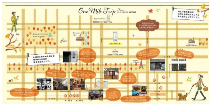
ワンマイルトリップマップ（イメージ）

本プランは、札幌の街歩きや店巡りで最新の魅力を体験いただけるよう、2018年9月より期間限定でスタートしました。本年6月には「じゃらんアワード2019 北海道ブロック じゃらん編集長が選ぶベストプランニング大賞」を受賞し、プランの独自性が評価されました。ホテルから徒歩圏内の地元民が通うハイセンスなカフェや雑貨店などをオリジナルマップでご紹介するとともに、各提携店舗で使用できる1,000円分の共通利用券（1泊1名さま当たり、500円券を2枚）を進呈しています。