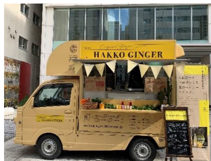
キッチンカー営業（2020年秋の様子）