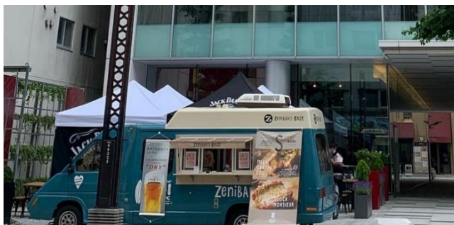
キッチンカー営業（2020年夏の様子）