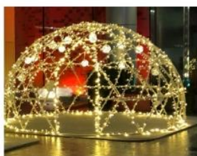
シャンパンゴールドライト