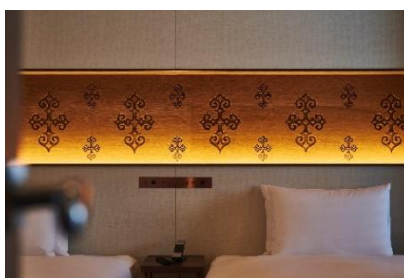
オリジナル文様を使用した客室