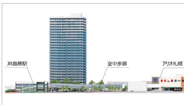
「空中歩廊」 (イメージ図)

札幌の都市再生を進める本事業の一環として、「苗穂」駅北口から商業施設「アリオ札幌」1階敷地までの約200mを屋根や壁で覆われた全天候型の空中歩廊で結びます。「苗穂」駅の南北を結ぶ自由通路にも直結し、雨や雪の影響を受けることなく、快適にご移動いただけます。今後、アリオ札幌2階部分へ空中歩廊の開通を予定していますが、その時期については現在未定です。