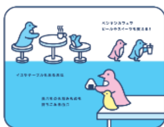
親子にやさしいすみだ水族館 お弁当持って、親子でピクニック気分