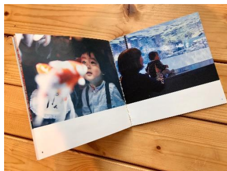
水族館デビューアルバム イメージ