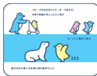
親子にやさしいすみだ水族館 ほどよい広さで、親子にぴったり