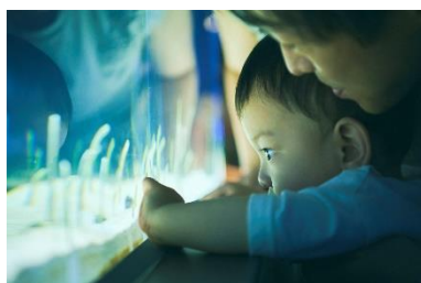
いきものと近くで出会える

お子さまのお出かけの際に気になるのが、授乳室などの設備。すみだ水族館には、おむつ替え台が計8台あります。授乳室は各階1カ所ずつあり、どちらもミルクが作れる給湯器付きです。また、定期的な換気やお客さまの手が触れやすい箇所を頻繁に消毒するなど、「三密回避」と「衛生管理対策」に努めています。