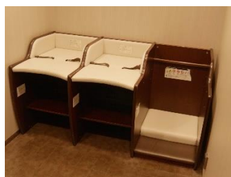
おむつ替え台も充実