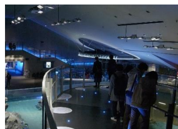
スロープでベビーカーの移動も安心