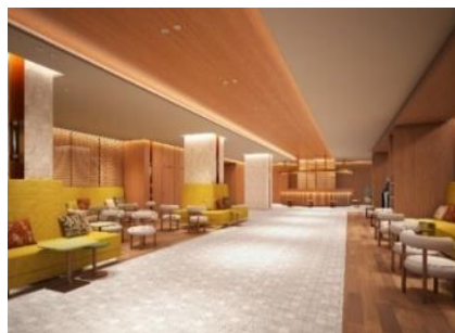
「虹館」ロビーラウンジ (イメージ)

また、チェックイン前にアクアビートや棚湯などをご利用されるお客さまのために、チェックイン前に荷物を預けられるロッカーをエントランス近くに設置しました。キャリーバックにも対応可能な鍵付きチェーンも備わっています。ロッカーは、虹館にご宿泊のお客さまはいつでも無料でご利用いただけます。