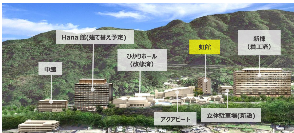
大規模リニューアル完了後のイメージ