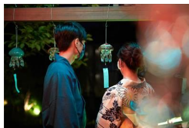
ライトアップのようす (イメージ)

暗くなった「京の里山」エリアで温かい光がクラゲ風鈴を照らし、日中とは違った雰囲気を味わうことができます。「京の里山」エリアを散策しながら夜風に響く風鈴の音色もお楽しみください。