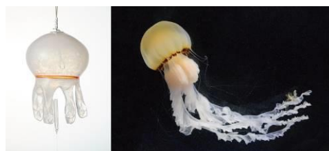
インドネシアンシーネットル