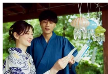
クラゲ風鈴と川柳（イメージ）

当館の「クラゲワンダー」で展示する約30種*のクラゲの中から、20種類のクラゲたちをモチーフに制作した約130個のクラゲ風鈴を館内で展示します。風鈴は新潟のガラス専門店「TAKU GLASS」が制作。短冊には、飼育スタッフが考案したクラゲにまつわる川柳が描かれています。色、形、触手の長さなど種類ごとに特徴が異なる多種多様なクラゲの魅力を伝えたいという飼育スタッフの想いと丹精な職人技が融合し、暑い京都の夏を涼やかに演出します。