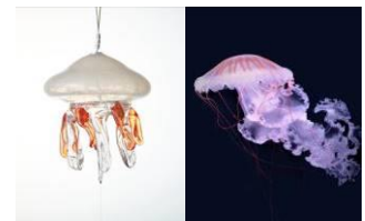
クリサオラ・プロカミア