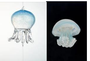
カラージェリーフィッシュ