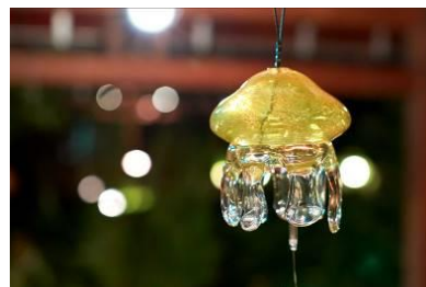
ライトアップされたクラゲ風鈴 (イメージ)