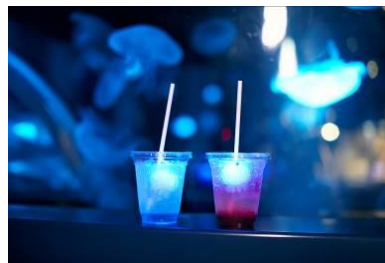
「光る★クラゲソーダ」

クラゲ風鈴の夜間ライトアップをより気軽にお楽しみいただけるように、午後 5 時以降からご利用いただけるドリンク付きのウェブチケットを数量限定で販売します。ドリンクは、「夜のすいぞくかん」限定で販売している「光る★クラゲソーダ」のブルーハワイ味のブルーとカシス味のレッドの 2 種類からお選びいただけます。