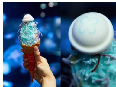
「クラゲ発生！ブルーソフト」

クラゲをモチーフにした見た目もインパクトのある暑い夏にぴったりの限定メニューです。爽やかなラムネ味のソフトクリームの上に、クラゲの形のマシュマロとクラゲの触手に見立てたカラフルでコリコリとした食感の海藻麺をトッピングしました。