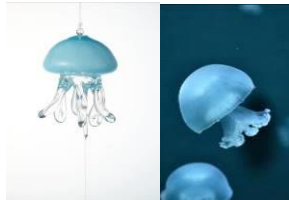
キャノンボールジェリーフィッシュ