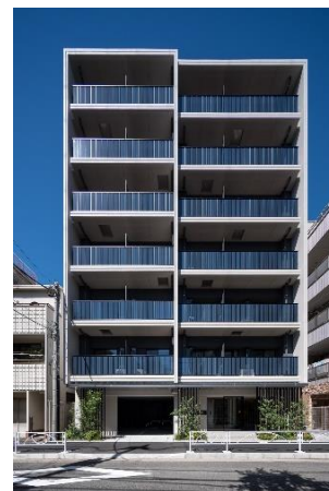
ライオンズフォーシア押上 (2021年8月竣工)