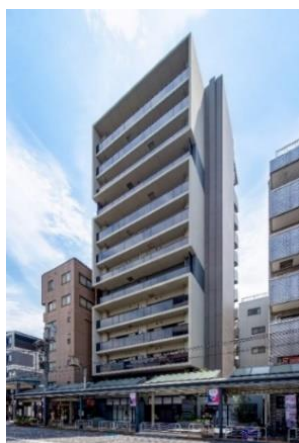
ライオンズフォーシア清澄白河 (2021年5月竣工)

「ライオンズフォーシア」は、2007年より展開する、分譲マンションの開発で培ったノウハウを活用した大京の賃貸マンションブランドです。これまで東京・神奈川・大阪で19棟の開発実績（本物件含む）があり、都心で働く20代～40代のシングルや共働きのご夫婦、小さなお子さまのいるご家族を中心にご入居いただいています。外観デザインはホテルや商業施設のトレンドを取り入れながら一棟一棟のデザインにこだわり、間取りは都心の賃貸居住者の生活ニーズに対応した多彩なプランを企画しています。