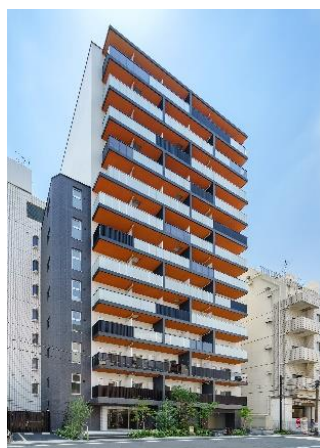
ライオンズフォーシア両国 (2021年7月竣工)