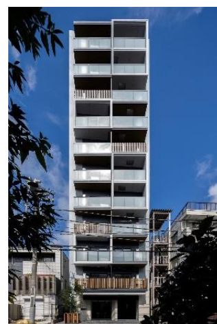
「ライオンズフォーシア高輪」外観