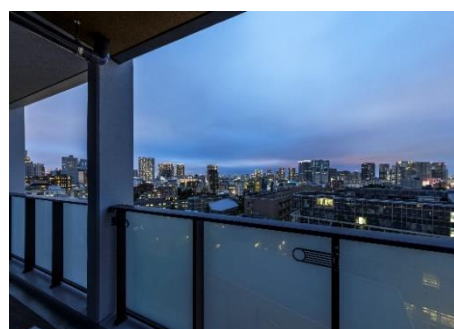
最上階からの眺望