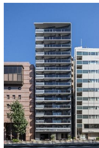
「ライオンズフォーシア五反田」外観