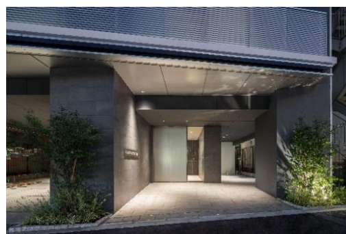
「ライオンズフォーシア五反田」エントランス

「ライオンズフォーシア高輪」は、東京メトロ南北線・都営三田線「白金高輪」駅徒歩7分ならびに「白金台」駅徒歩11分、都営浅草線・京浜急行本線「泉岳寺」駅徒歩11分と3駅4路線が利用可能で、ターミナル駅「品川」駅から徒歩18分のヒルトップエリアに位置します。周辺は、泉岳寺をはじめとして由緒ある寺社が数多く点在し、閑静でかつ緑多き佇まいの都心でも名高い住宅街です。本物件は、1K、1DK、2LDKの3タイプからなり、高輪のヒルトップにあるため上層階の部屋からは東京タワーをはじめ、品川や六本木エリアまで広く見渡せます。