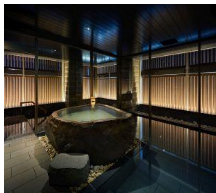
「ONSEN RYOKAN 由縁 札幌」大浴場