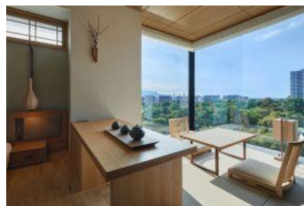
「ONSEN RYOKAN 由縁 札幌」客室

本物件は、当社と三信住建株式会社（本社：東京都中央区、社長：信田 博幸）が開発し、UDS 株式会社（本社：東京都渋谷区、社長：黒田 哲二）がデザインを担当しました。物件の斜め向かいには北海道大学植物園の豊かな緑が広がる立地で、植物園越しには札幌を囲む山々が連なり、札幌中心部にありながら北海道の豊かな自然を感じられるホテルです。約 20 m 2 から約 40 m 2 とスタンダードクラスでもゆったり過ごせる全 182 室で、大浴場には露天風呂やこもり湯や打たせ湯を設けています。