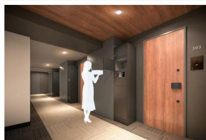
「ライオンズスマートボックス」

「ライオンズスマートボックス」は、分譲マンションの各住戸玄関に設置する居住者専用の宅配ボックスです。居住者は従来型の宅配ボックスのように、マンションのエントランスまで足を運ぶ必要がなくなり、「置き配」での盗難や雨濡れなどの問題を解決できます。ボックス内には3つの収納スペースを設け、クリーニング品や食品など種類の異なる複数の荷物にも対応できます。昨今の宅配便の増加に伴う再配達などの課題に対応するとともに、居住者の利便性を高める取り組みが評価されました。