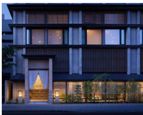
「ONSEN RYOKAN 由縁 札幌」外観