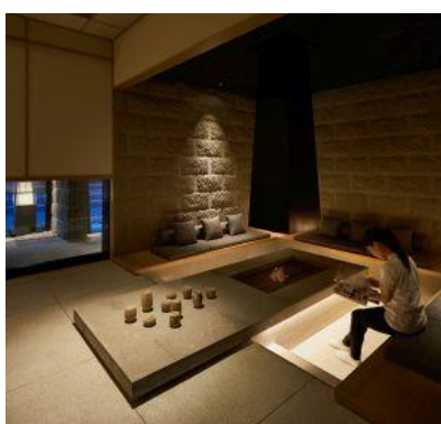
「ONSEN RYOKAN 由縁 札幌」いろり