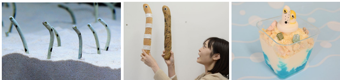
「11月11日はチンアナゴの日2021」

京都水族館（所在地：京都市下京区、館長：松本 克彦）は、11月11日の「チンアナゴの日」を記念して、2021年11月5日（金）～11月30日（火）の期間、チンアナゴの生態の魅力に迫るイベント「11月11日はチンアナゴの日2021」を開催しますのでお知らせします。