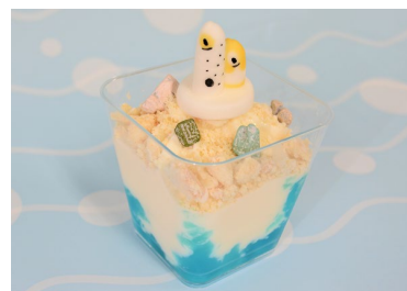
によきっと！ チンアナゴ&ニシキアナゴパフェ

チンアナゴと、ニシキアナゴが巣穴からからだを出してゆらゆらしている姿を再現したスイーツメニューです。海をイメージした青いゼリーと甘いバニラソフトの上に、棲み処の砂に見立てたクッキーと、チンアナゴとニシキアナゴがひょっこり顔を出したようすを再現したマシュマロをトッピングしました。