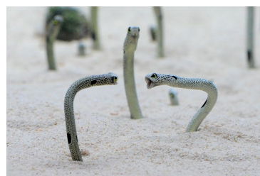
威嚇しあうチンアナゴ

巣穴からからだを出し、ゆらゆらと動く姿が特徴的なチンアナゴについて、その生態の謎に迫る解説映像を約150インチの大型モニターで放映します。全身を砂から出して水中を泳ぐようすや、2匹で威嚇しあうようす、うんちをする瞬間など、貴重な映像をわかりやすい解説を交えて紹介します。