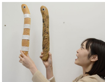
(右) なが〜い！チンアナゴパン (左) なが〜い！ニシキアナゴパン

全身が30センチ以上あるチンアナゴとニシキアナゴの長いからだをモチーフに、長さ40センチ以上の特大パンを製作しました。チンアナゴの黒い斑点模様をココアクッキーで再現するなど、見た目のかわいらしさにもこだわりました。シェアしても楽しめる一品です。