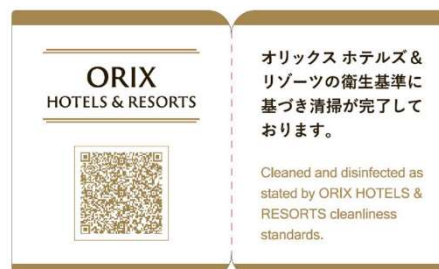
クリーンスティールームシール (イメージ)

クリーンスティールームシールは、客室をガイドラインに基づき清掃・消毒し、それらに加えてお客さまの手などが触れる頻度が高い箇所を専用クリーナーなどで丁寧に拭き上げたことを保証する目印です。客室清掃完了後、ドア部に貼付し、客室の衛生管理状態を確保します。