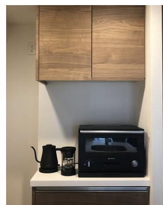
「上質な家電と暮らす家」 設置例