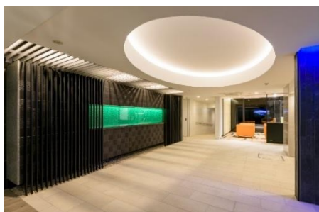
時間帯で色が変わるエントランスの壁面 （ベルファース西五反田）

1996 年より都内を中心に都市型賃貸マンションを開発し、賃貸マンションのブランドとして「ベルファース」を展開しています。都心に勤務するビジネスパーソンや単身赴任者にも納得のグレード感や快適性、きめ細やかな機能性を備えた住まいをご提供しています。