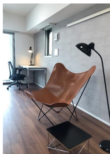
「家具家電等利用サービス」の家具例

本物件は、都営大江戸線「両国」駅より徒歩5分、JR 総武線「両国」駅から徒歩11分に位置し、汐留、新橋、新宿などの主要なオフィス街にも電車で20分圏内と優れた交通アクセスを有します。周辺は中高層マンションや戸建てが建ち並ぶ落ち着いた住宅環境で、徒歩5分圏内には小学校やクリニック、食料品スーパーがそろいます。