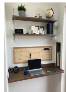
ワークスペース （ベルファース木場）