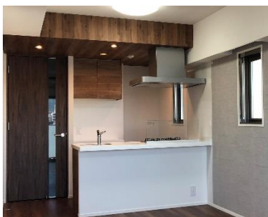
カウンター付き対面キッチン

間取りは、1DK（29戸）、1LDK（13戸）の全6タイプです。居室内やトイレには、木目調のクロスやモダンなデザインのアクセントクロスを採用し、住まいのデザイン性を高めています。また、全住戸のエントランスにコート掛けフック、リビングにはモノを吊るす・掛ける・置くことが可能な長押レールを設置し、機能面にもこだわりました。そのほか、空間を有効活用し収納棚やハンガーパイプを設けた住戸（2戸）や、在宅ワーク時に便利な壁面の折り畳みテーブルを備えた住戸（1戸）をご用意しています。