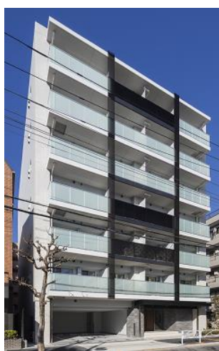
ベルファース両国 外観

オリックス不動産株式会社（本社：東京都港区、社長：深谷 敏成）は、賃貸マンション「ベルファース両国」（東京都墨田区、全42戸）がこのたび竣工し、3月上旬より入居を開始しますのでお知らせします。