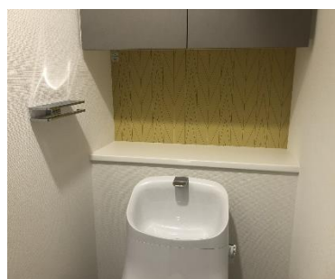
モダンなアクセントクロス