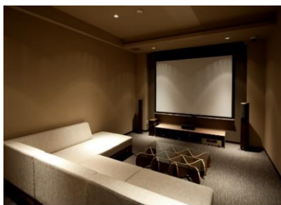
シアタールーム （ベルファース目黒）