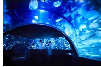
新展示エリア「クラゲワンダー」