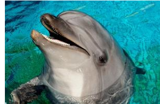
ハンドウイルカ「キア」