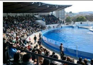
グランドオープン当日のようす