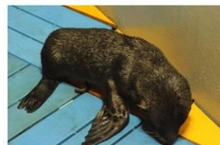
ミナミアメリカオットセイの赤ちゃん