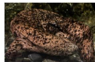
「オオサンショウウオの日」認定